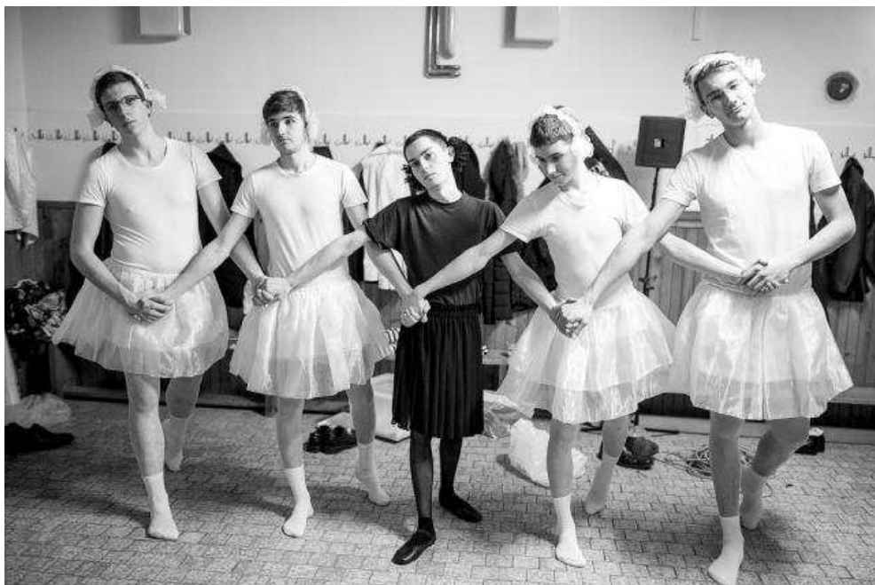
Aktéři baletního vystoupení