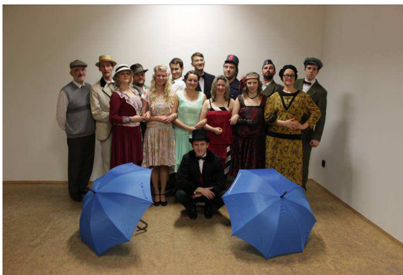
farní divadelní soubor HerKA

Aprílový příběh, který vstoupil do dějin celé Dandovy rodiny. Vypráví jej emancipovaná studentka Stela, která se připravuje na dráhu doktorky práv a roli moderní emancipované ženy první poloviny 20. století.