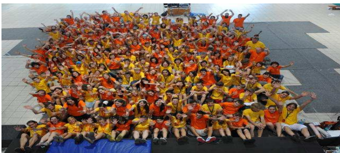
parta „citrusů“ – dobrovolných hlídačů

Přestože na každém kroku jsme mohli mít návštěvníky ze všech krajů naší republiky, prostor pro ticho, soukromí a soustředění byl stále nadosah. Své krásné zážitky mají i děti z dětské konference, kde pečlivě a s chutí hlídají „citrusy“ (mladí od 16 let). Letos se starali o 620 dětí pečlivě označených jmenovkou a rozčleněných do komorních skupinek. Jejich program se odehrával uvnitř coby tvůrčí dílničky, divadla, zpívání, anebo venku honičky, hry, jízdy na kole, koloběžkách apod.