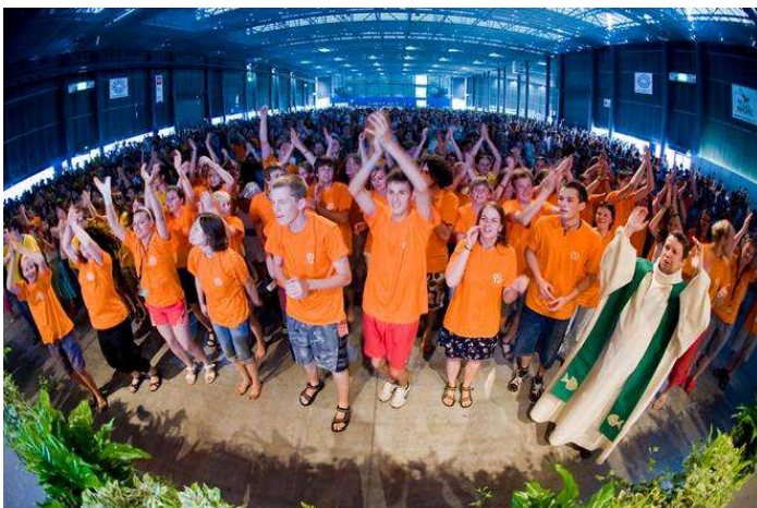
rekordních, spokojených 7000 účastníků letošního ročníku