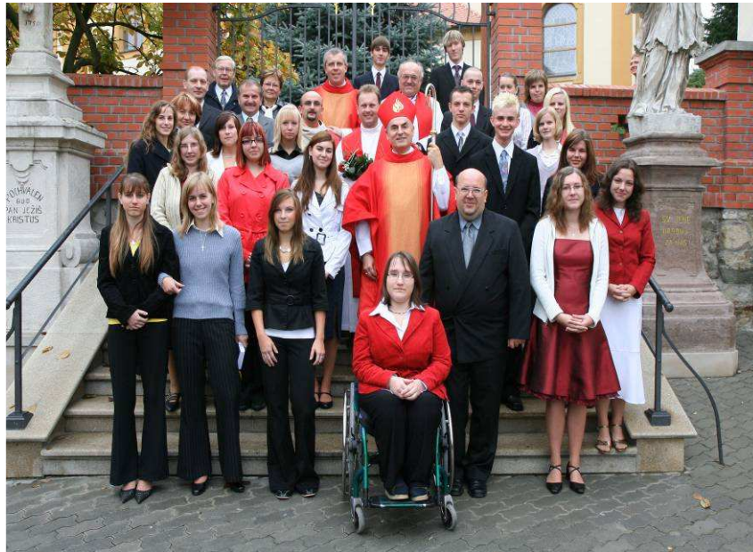
Biřmovanci - Šlapanice