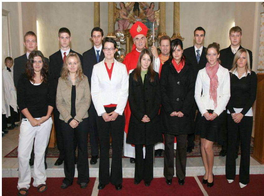
Biřmovanci - Prace